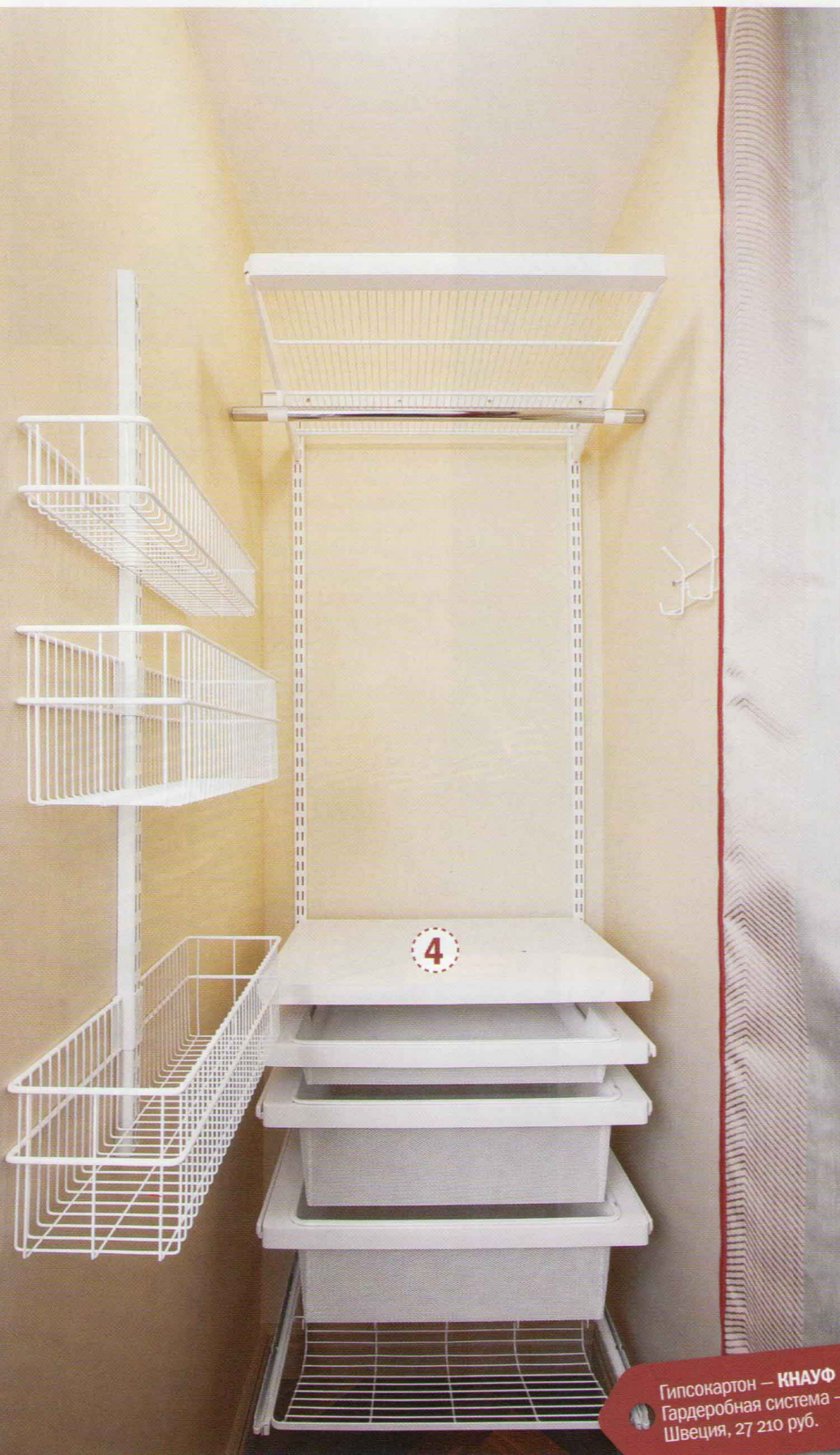
Гипсокартон — КНАУФ Гардеробная система — Швеция, 27 210 руб.

4 Гардеробную выделили с помощью перегородки из гипсокартонных листов. Стены внутри этого небольшого пространства выкрашены составом на водной основе того же песочно-бежевого оттенка, что и на лепных элементах в комнате. Внутреннее наполнение собрано, как конструктор, из специальной системы комплектующих: три выдвижные корзины для белья, полка, обувница и сетка для головных уборов закреплены на металлических направляющих, дополнительно на стенах развешаны стальные сетки, крючки и штанга для одежды. От остального пространства комнаты гардеробная скрыта занавеской из той же ткани, что портьеры на окнах.