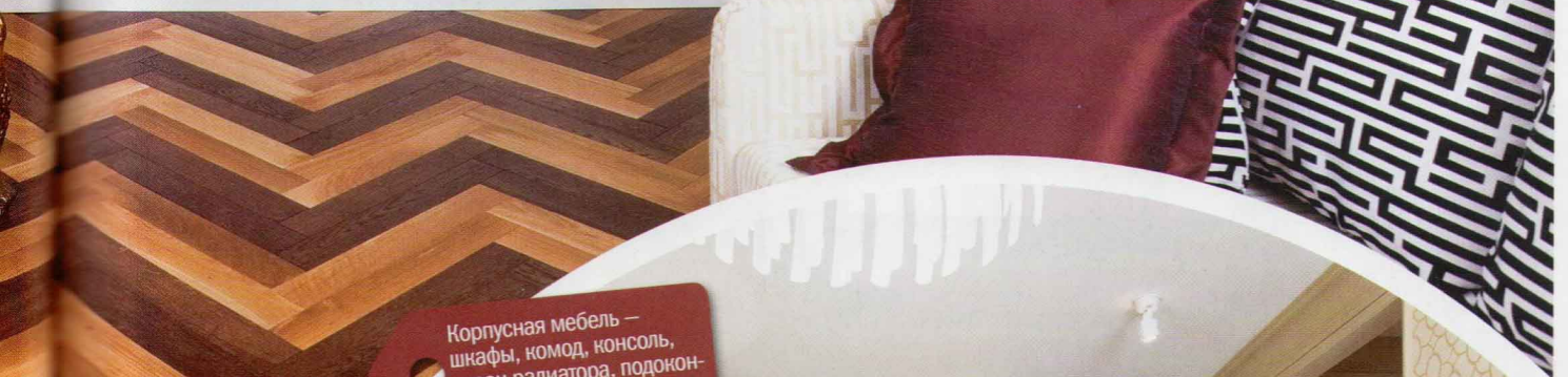
Корпусная мебель — шкафы, комод, консоль, экран радиатора, подоконник; 185 000 руб.

3 Симметричная система хранения — два шкафа-витрины и комод — одновременно функциональна и декоративна. Стекланные дверцы изнутри закрыты шторками из ткани с геометрическим узором. Они на липучке, при необходимости можно снять и постирать. Или вообще убрать, если захочется выставить на обозрение содержимое застекленных полок. Фасады шкафов покрыты белой эмалью с патиной.