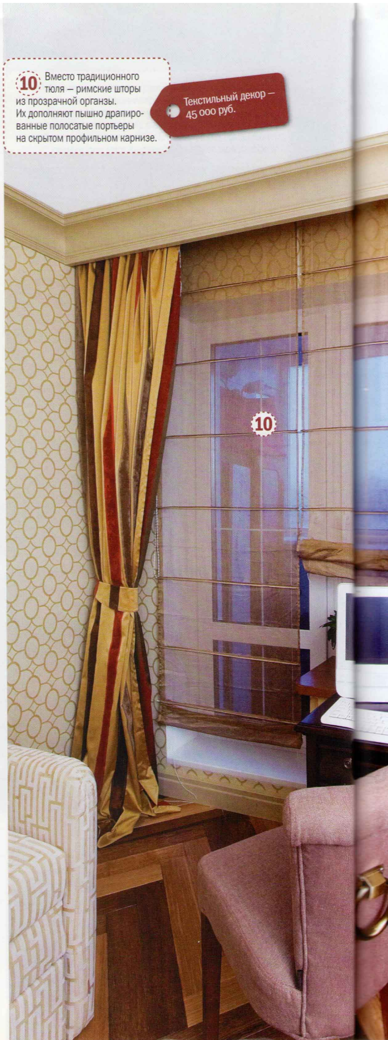
10 Вместо традиционного тюля — римские шторы из прозрачной органзы. Их дополняют пышно драпированные полосатые портьеры на скрытом профильном карнизе.