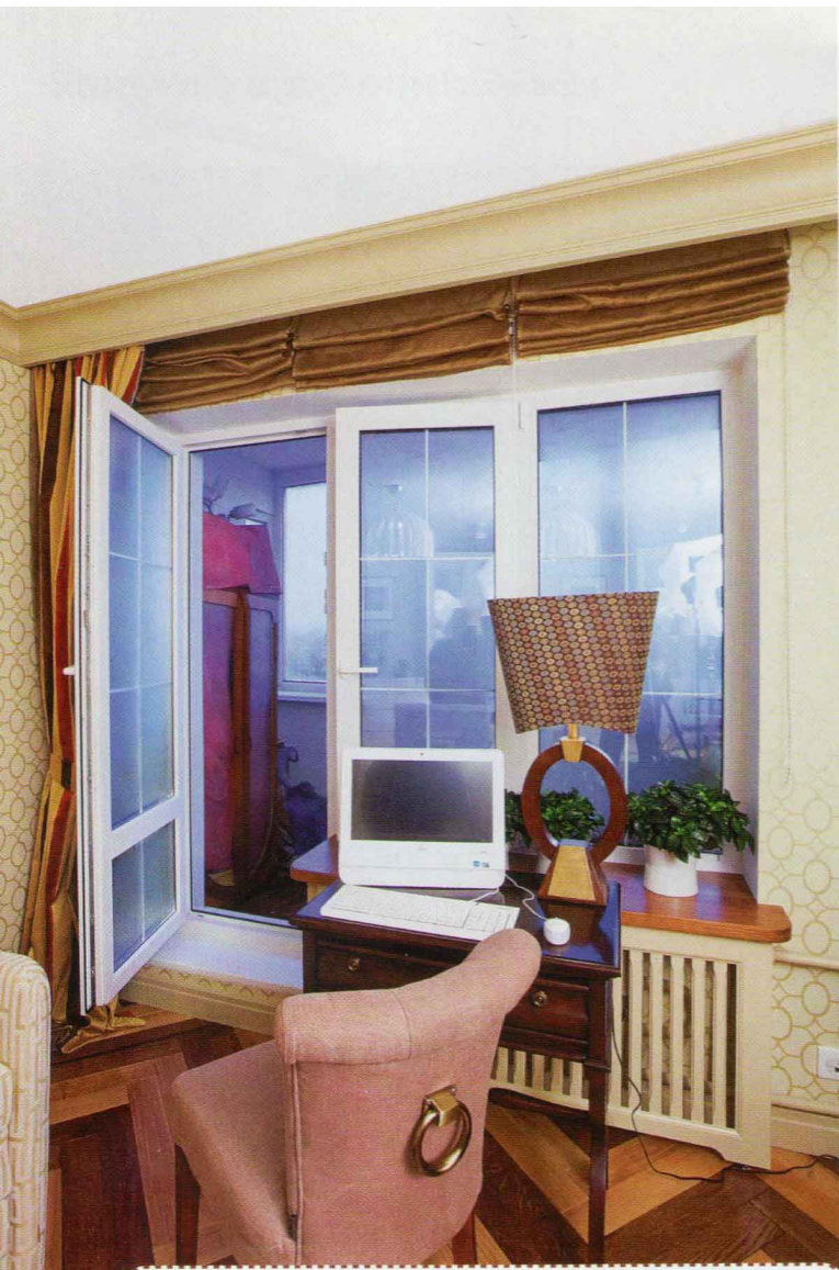
9 Декоративная раскладка окна поддерживает заданную в отделке тему четких геометрических линий. Подоконник изготовлен на заказ из массива ясеня, тонирован морилкой под орех и покрыт лаком.